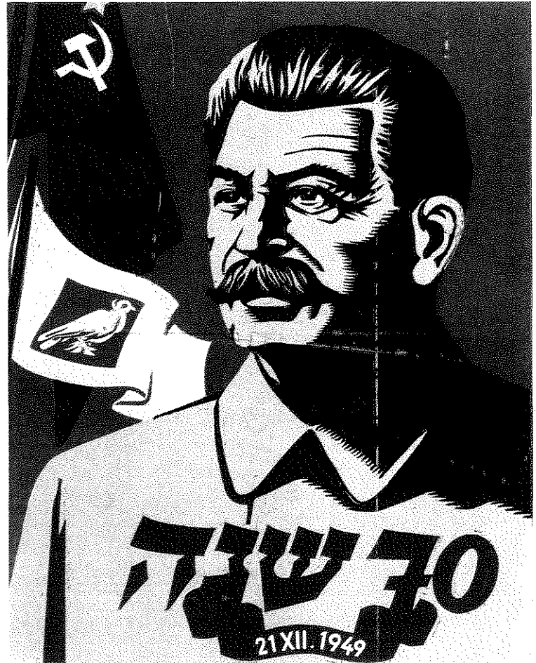
פולחן האישי של סטלין היה לא רק ברוסיה. כרוז זו הודבקה על לוחות המודעות בישראל במלאות לסטלין 70 שנה, בדצמבר 1949